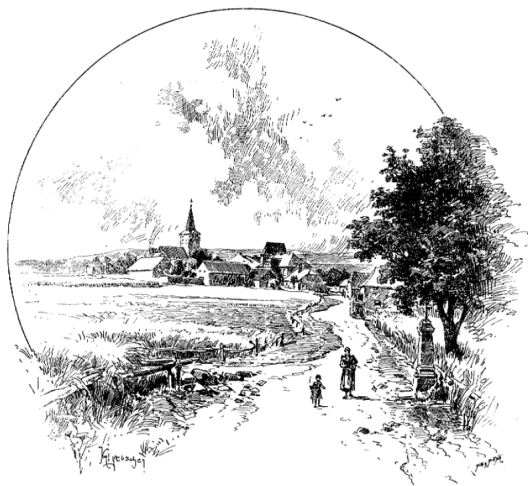
TVRZE V OKOLÍ ČACHROVA.