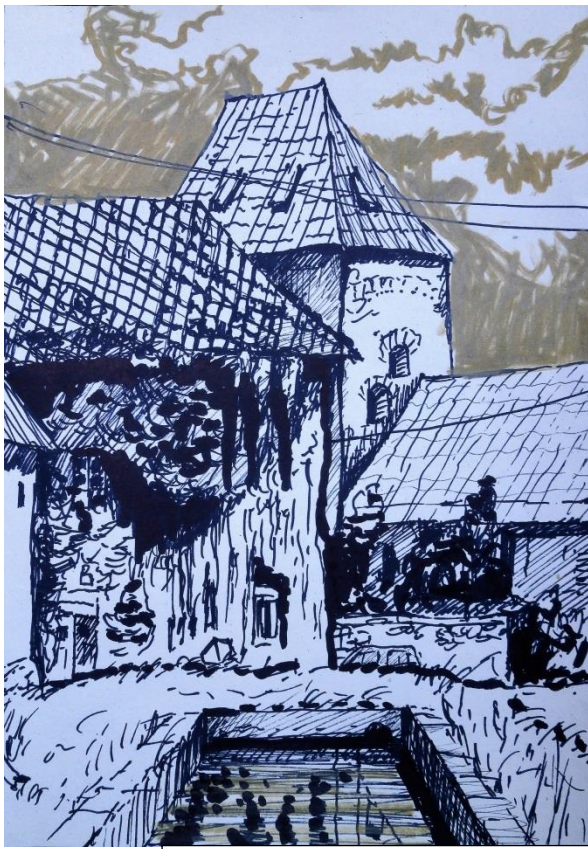
Dnešní podoba čachrovského pivovaru