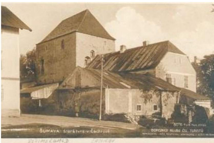
Tvrz s přístavbami

Za války se nedělaly žádné tancovačky, ale v přístavbě k tvrzi bydlel majitel Faltys. A v té přístavbě se dělaly tajné zábavy. Hrál se na