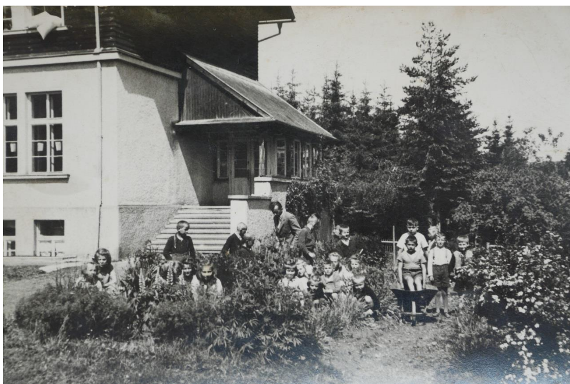
Jesenská (kunkovická) škola, práce na pozemku