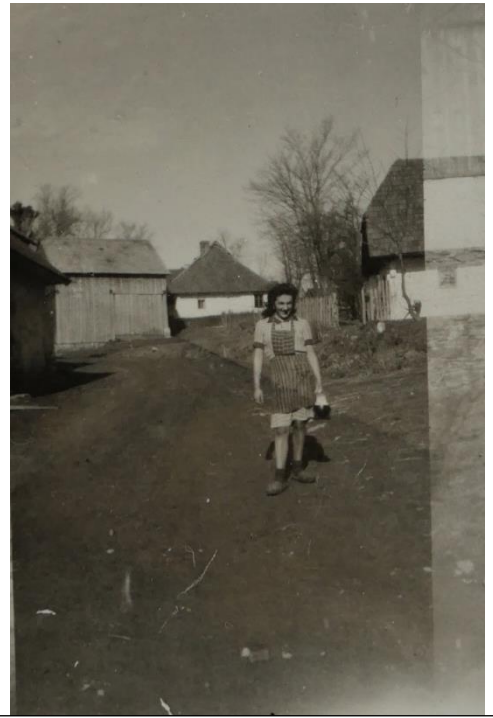
Staré Kunkovice s domem č. p. 5, kde dědeček provozoval ševcovskou dílnu