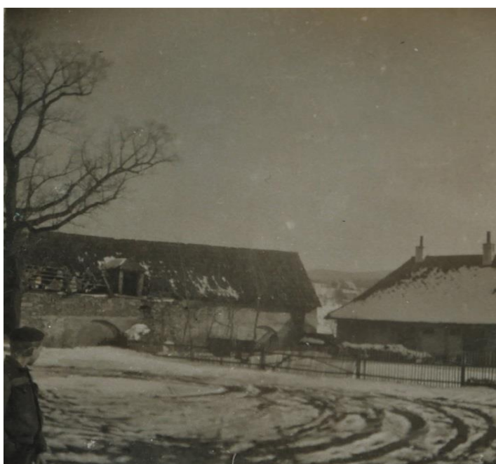
Schreinerova kočárovna (zbourána)