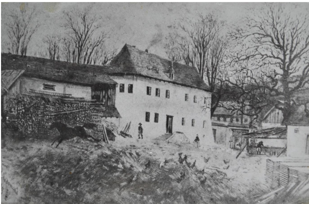
Kunkovické hospodářství se zámečkem (originál v sušickém muzeu)