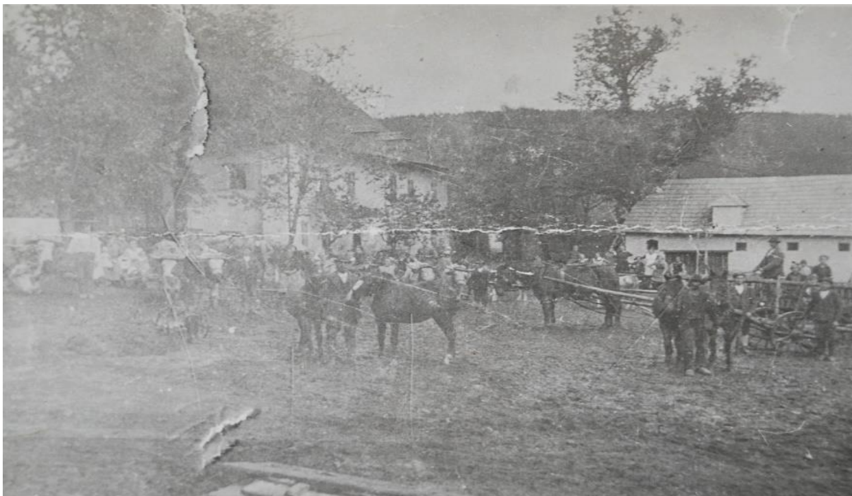
Hospodářství statkáře Schreinerera v Kunkovicích