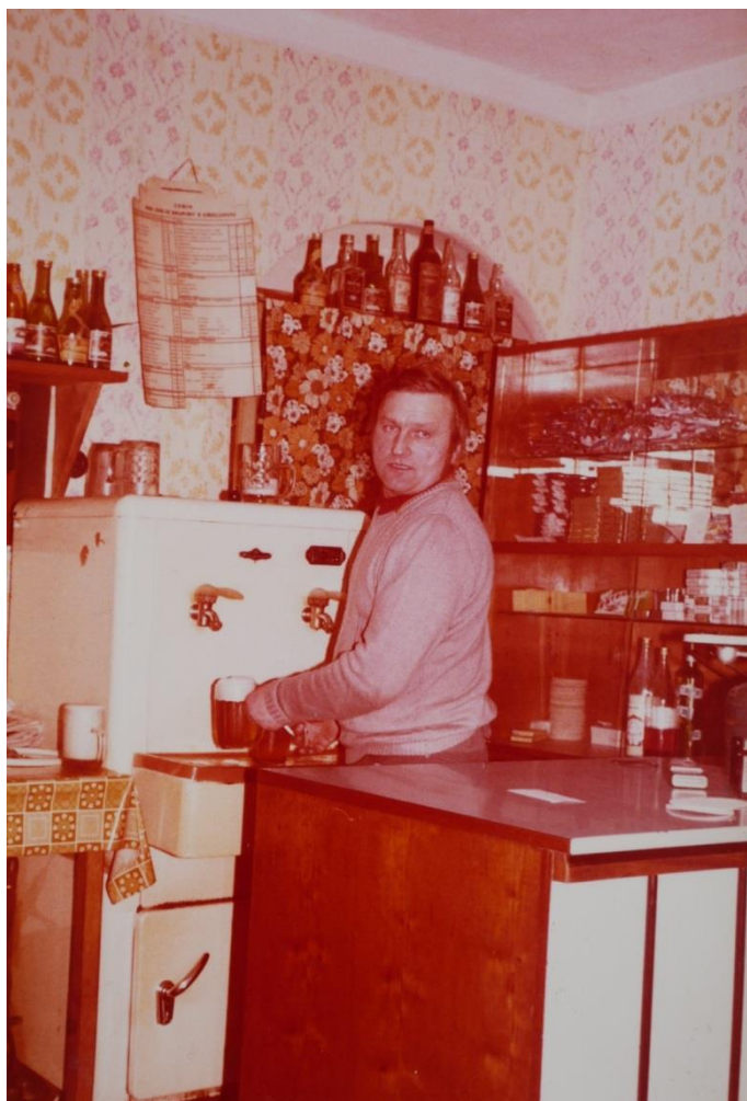
Při čepování piva

Pamatujete si, kolik hospod bylo ve vašem dětství v Kunkovicích?