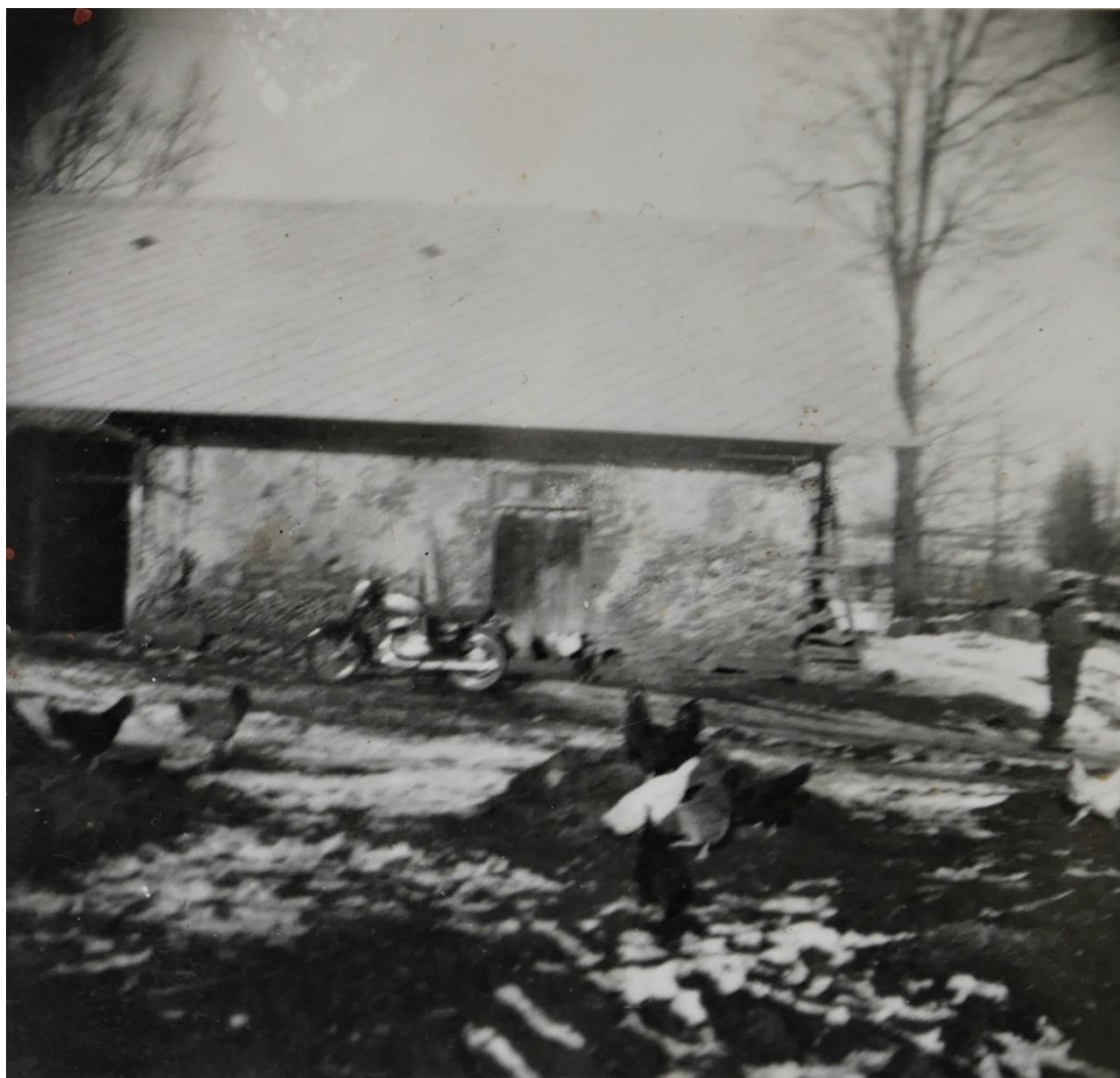
Ubouraný pivovar Schreinerova statku