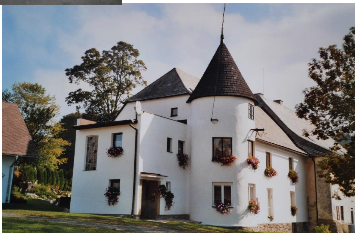
Nynější podoba domu