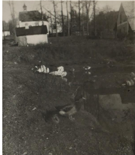
Pekárna pod kunkovickou kaplí (zbourána)