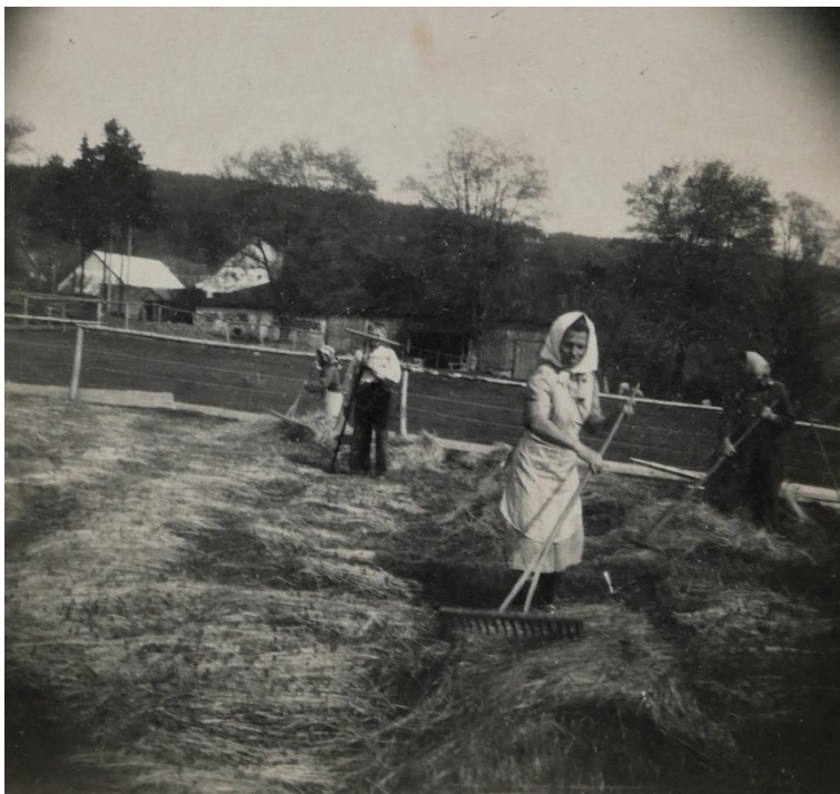
Sklizeň lnu za stodolou (dnes zastavěno)