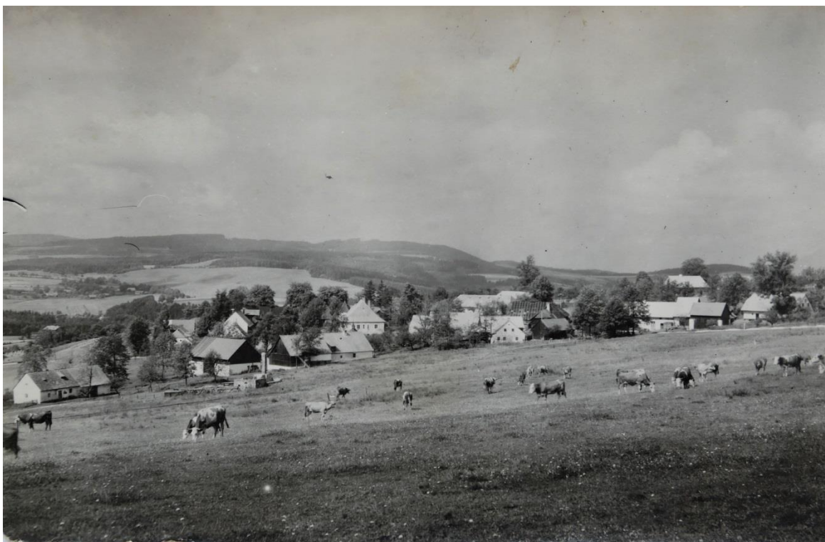
Staré Kunkovice od Telečku