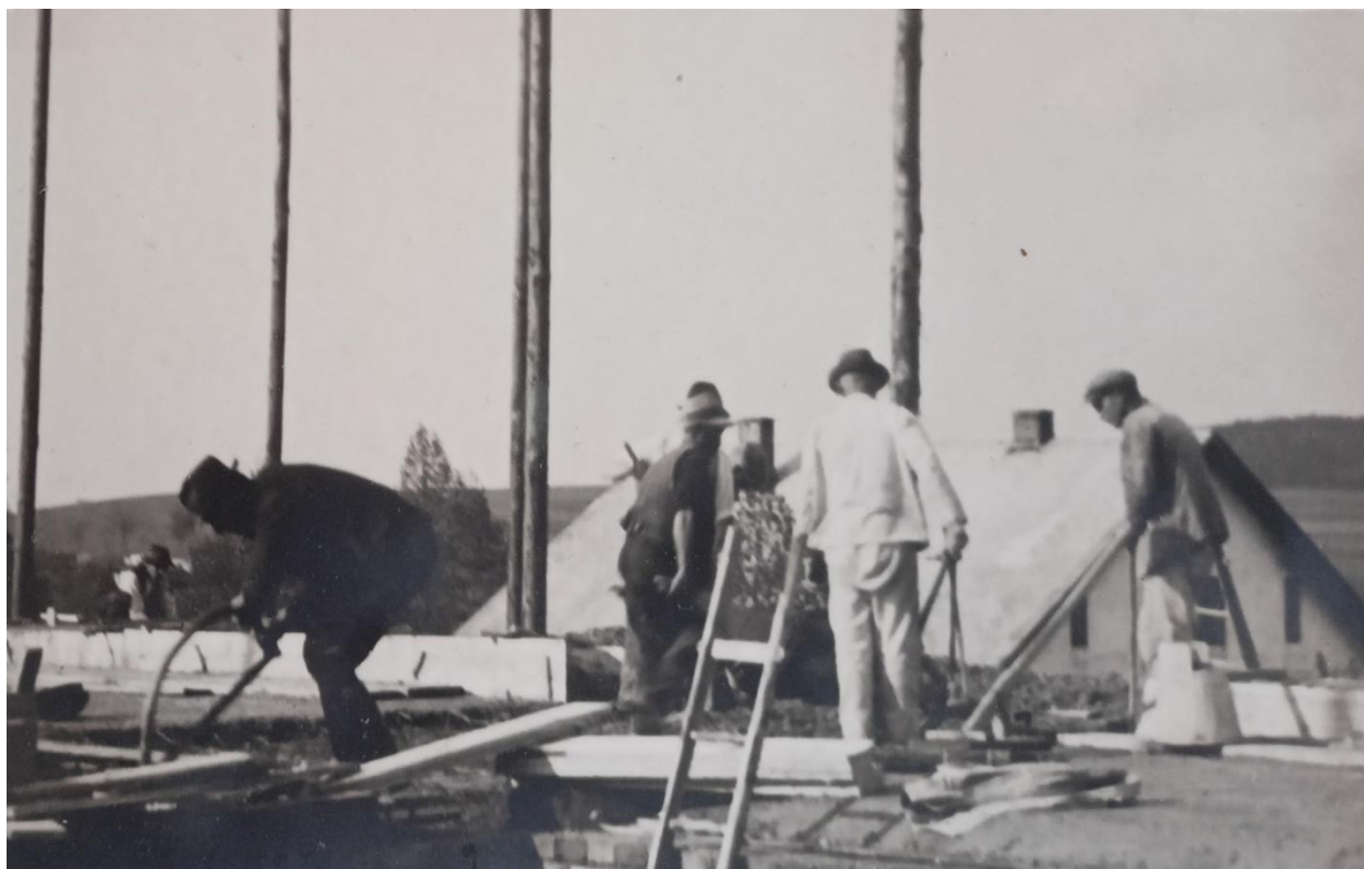
Obr. 5: Stavba školy, zdroj: archiv školy