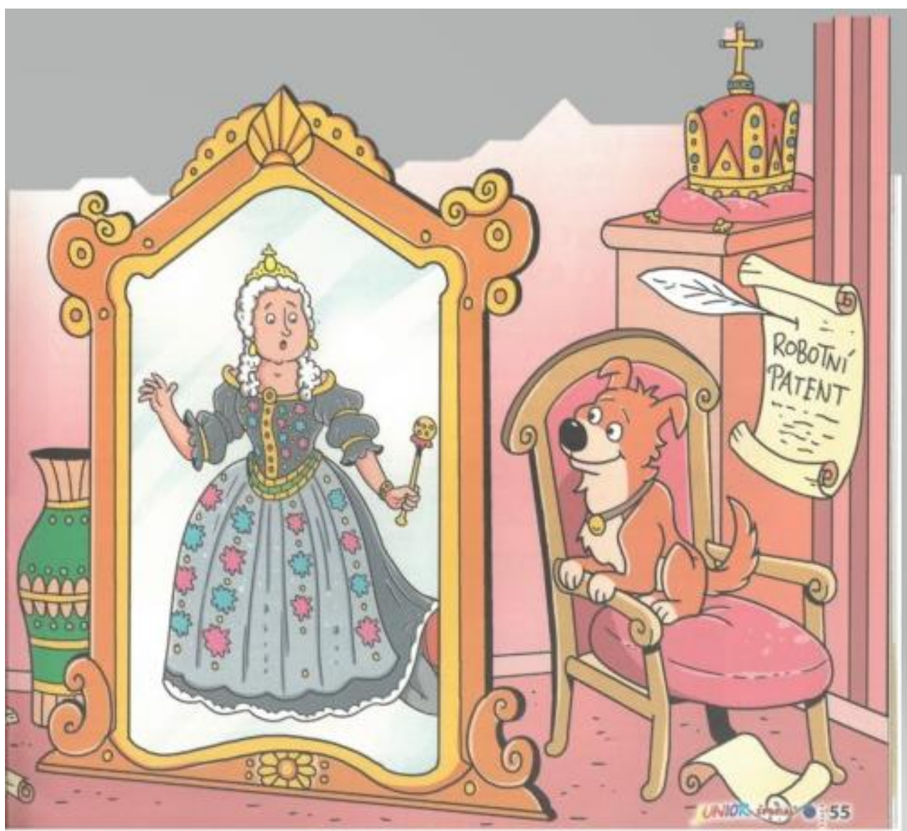
Obr. 12: Obrázek z časopisu JUNIOR, 2/2021, str. 54-55.