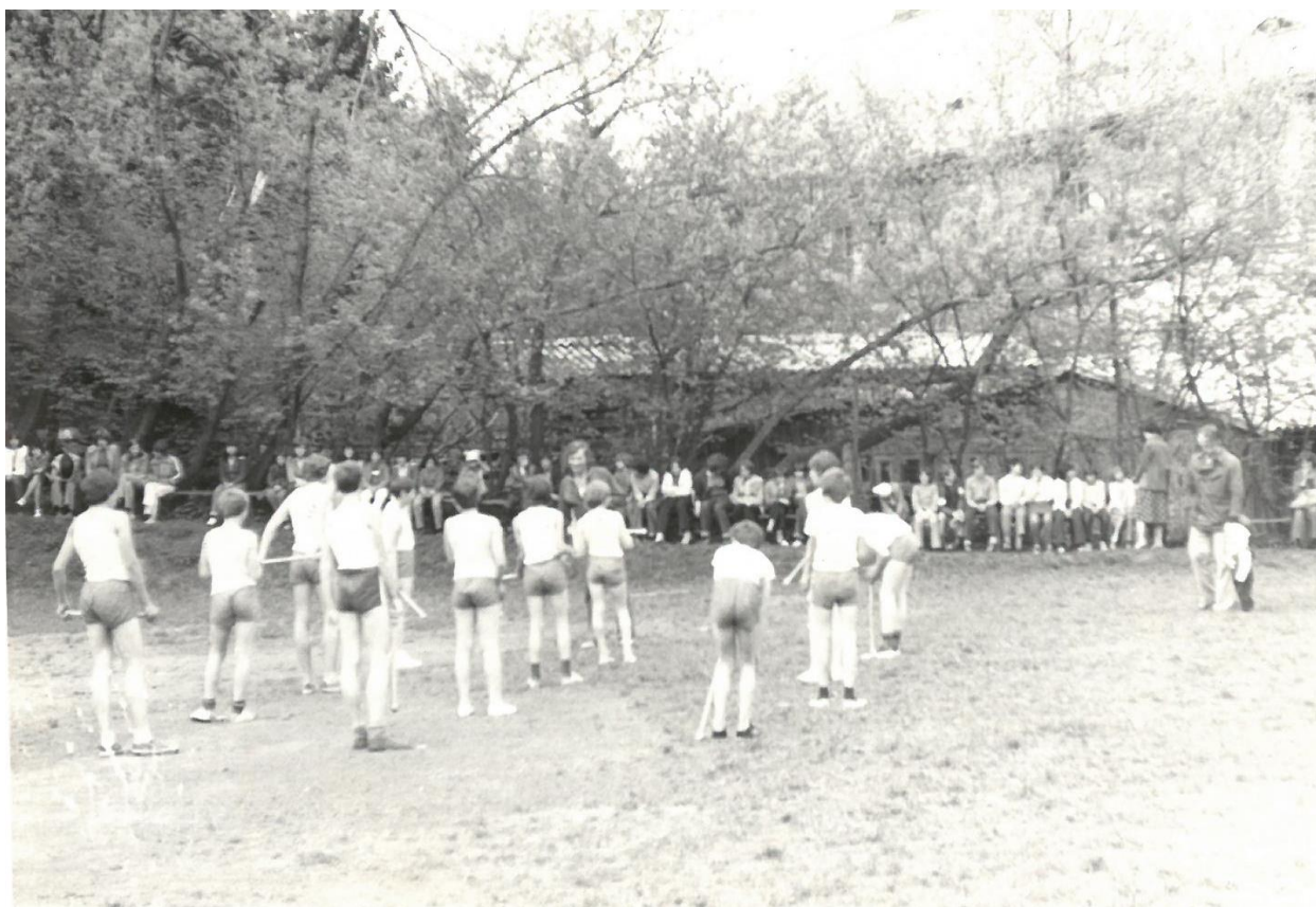
Obr. 9: Spartakiáda 1980 na školním hřišti

V tomto školním roce byl zaveden 6. dubna letní čas, který trval do 28. září 1980. Třídy ve školním roce 1980/81 byly na škole omezeny jen na 8 tříd. Žáci 9. třídy dojížděli do Klatov. Následující rok navštěvovalo školu 94 žáků. Ti mohli v zimních měsících pro výcvik lyžování využívat nový obecní vlek. Došlo k drobné modernizaci vybavení školy. K povinnostem patřila i aktivní účast žáků na oslavách VŘSR, akcích Národní fronty, Partyzánském samopalu a dopravní výchově. Ve spolupráci se SSM začala tradice stavění májek.