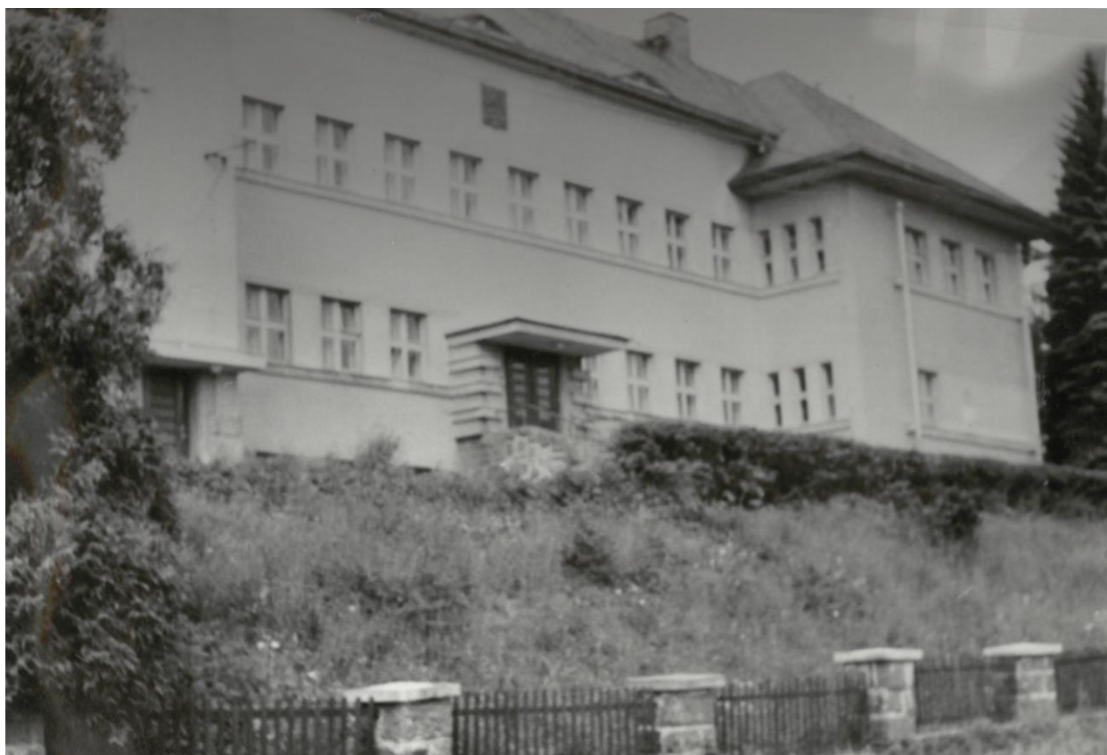
Obr. 10: Budova školy v roce 1983, zdroj: archiv školy

místní úrovni. Zdejší impulsem byla také angažovanost faráře Miloslava Vlka, pozdějšího kardinála.