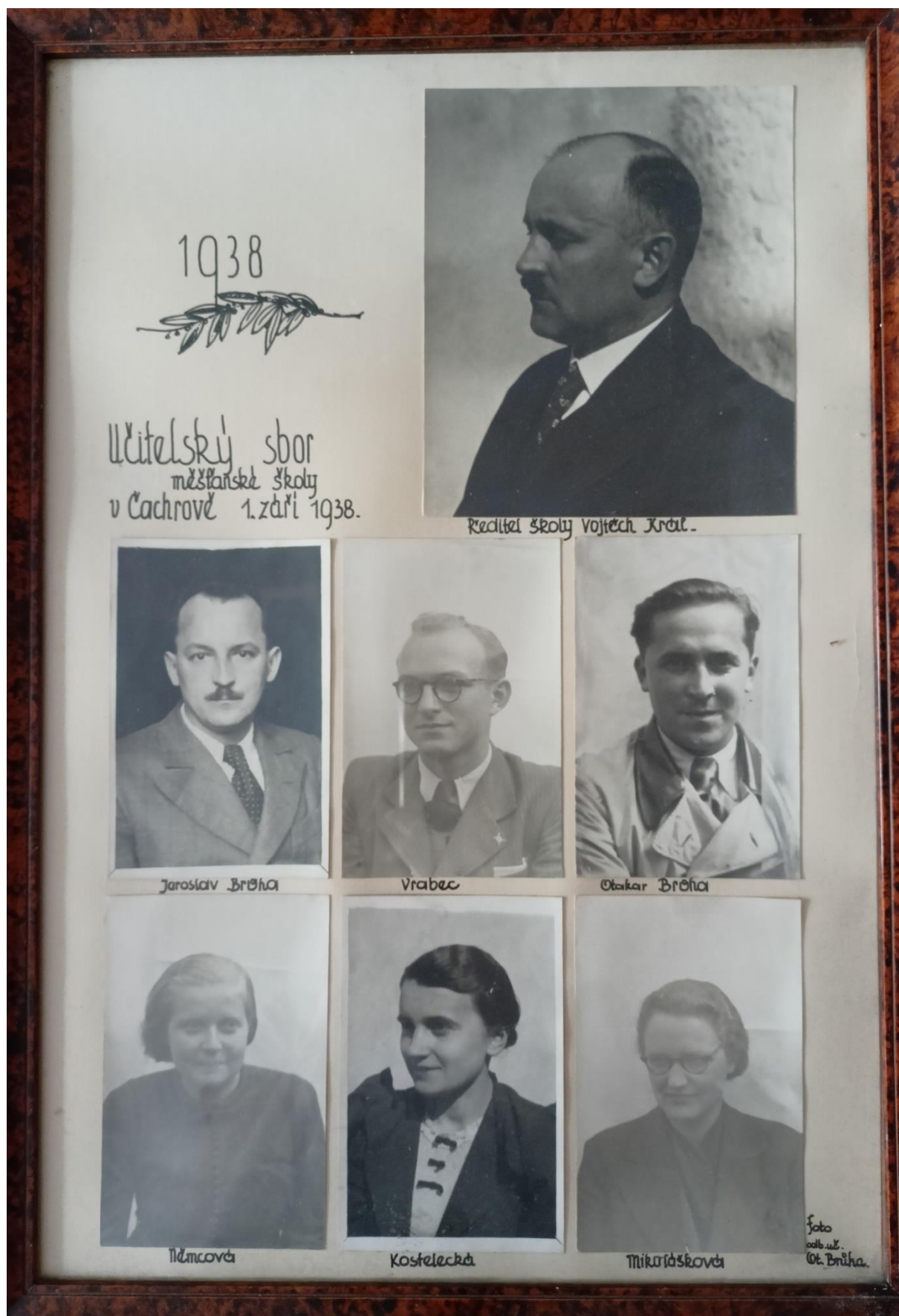
Obr. 8: Učitelé