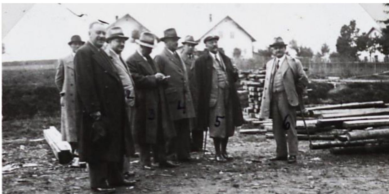
Obr. 3: Komise, která schvalovala stavbu školy