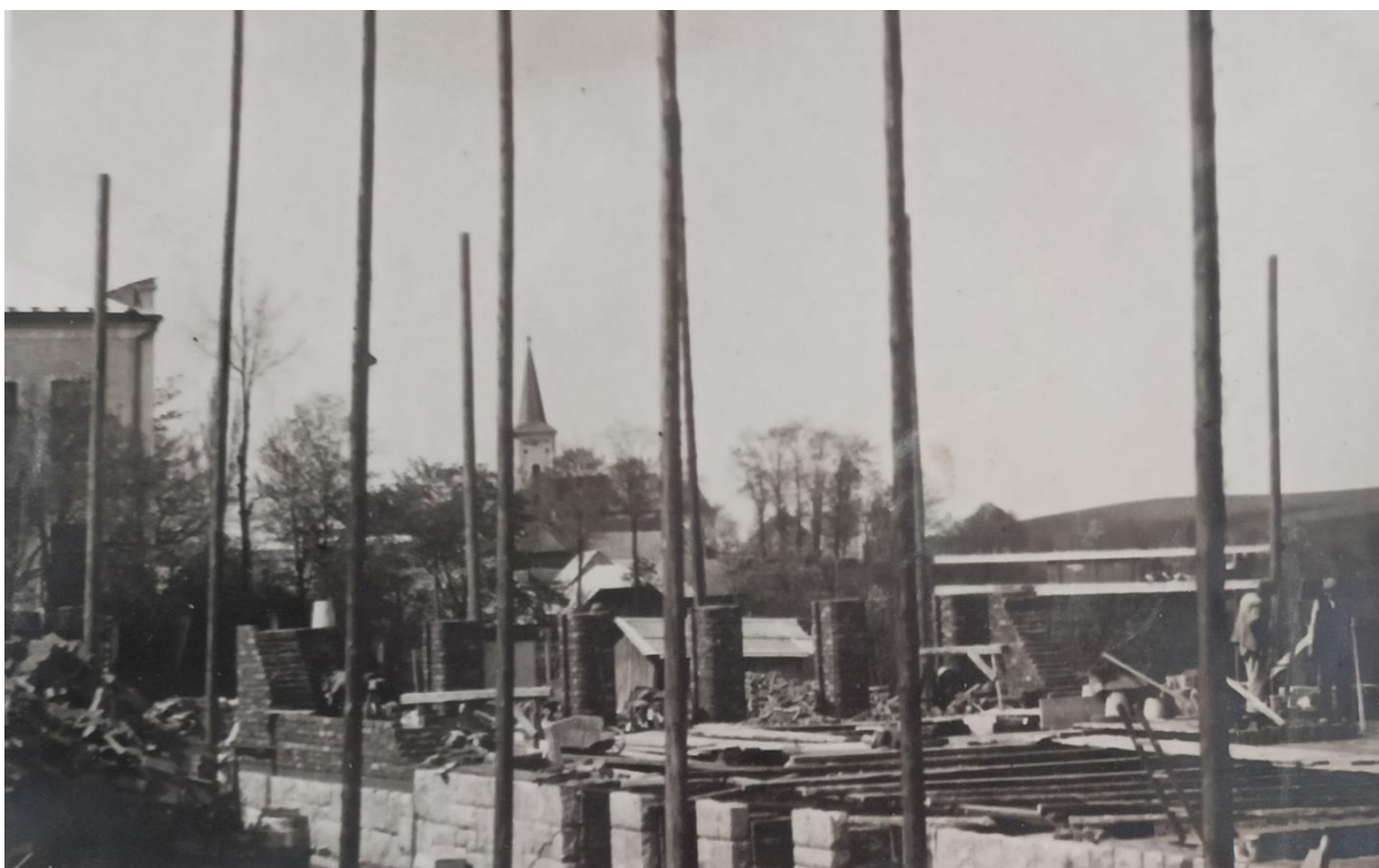
Obr. 4: Stavba školy