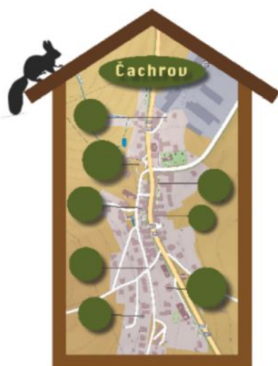
Mapky - jako svaté obrázky