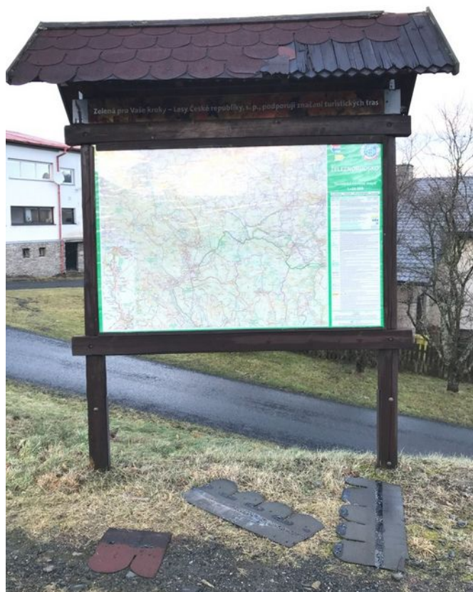
Smutný stav stávajícího informačního servisu, Čachrov