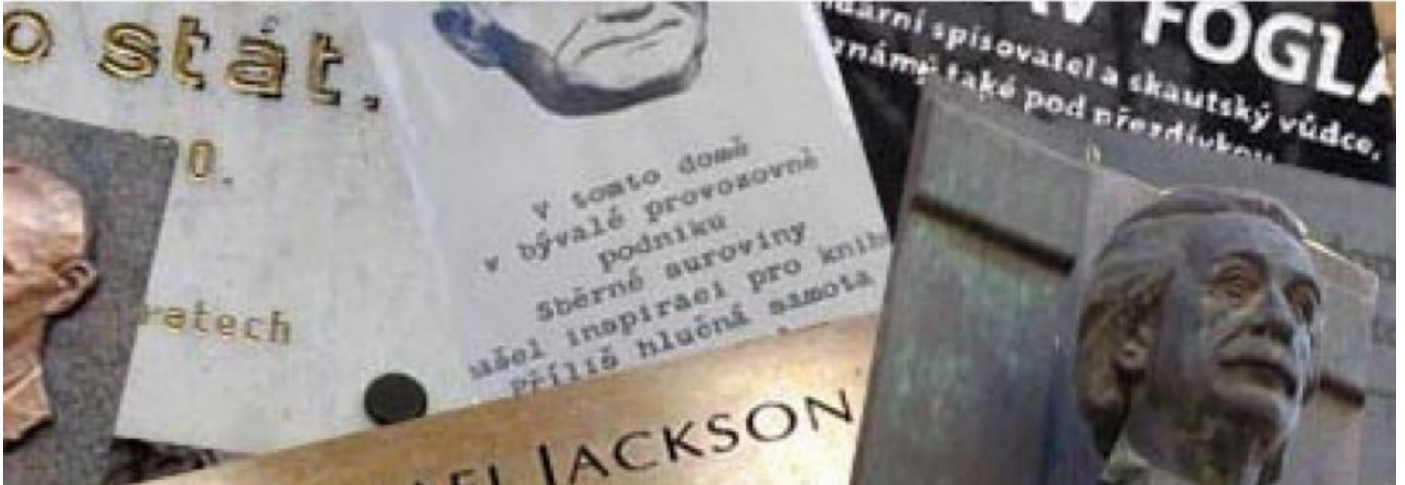
Pamětní desky, busty, sochy, památníky. Slavné osobnosti pozvedají prestiž českých měst i