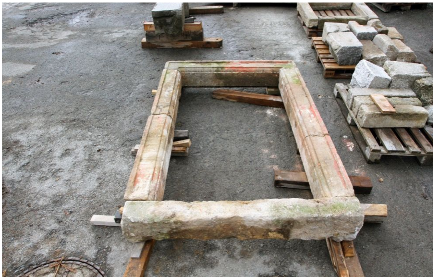
Originální vstupní portál k bočnímu vchodu do kostela sv. Vavřince v

Gilmetti vlastně objevil v Čechách? Pocházel z půvabného lombardského městečka Como (*1662) na břehu stejnojmenného jezera a k nám přišel jako zedník a postupně se vypracoval na dozorce staveb a později i na stavitele. Zemřel v Čachrově 3. 9. 1730 (datum pohřbu) velmi náhle, pravděpodobně na mrtvici, a je pochován v kostele sv. Václava, jehož úpravy zahájil. Ve většině případů se nechával inspirovat slavnějšími stavbami, na příklad na Tanaberku u Kdyně v podobě půvabného farního a poutního kostela sv. Anny. Zůstalo za ním pozoruhodné dílo, které by si zasloužilo připomenout svého autora. Proto sochař Fiala navrhl pomník s použitím portálu ze sv. Vavřince, který by mohl stát v Čachrově jako pocta italskému staviteli, který u nás pracoval a zemřel.